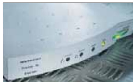
HELATAG etikett for permanent merking av gjenstander.