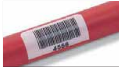
Laminering gir lang holdbarhet.